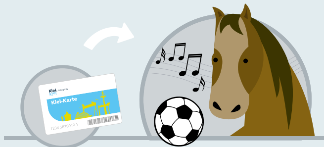
Mitgliedsbeiträge für Sport / Kultur / Freizeit