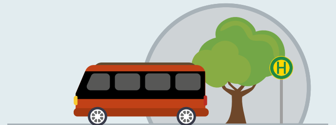
Schülerbeförderung und Klassenfahrten (extra Antrag beim Sozialleistungsträger)