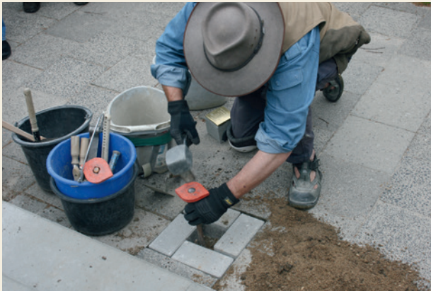
Der Kölner Künstler Gunter Demnig hat bereits mehr als 75.500 Stolpersteine für Opfer des Nazi-Regimes verlegt.

Auf den etwa 10 x 10 Zentimeter großen Stolpersteinen sind kleine Messingplatten mit den Namen und Lebensdaten der Opfer angebracht. Sie werden vor dem letzten frei gewählten Wohnort in das Pflaster des Gehweges eingelassen. Inzwischen liegen in mehr als 1.330 Städten in Deutschland und 25 weiteren Ländern Europas mehr als 75.500 Steine. Auch in Kiel werden seit 2006 jährlich neue Stolpersteine verlegt.