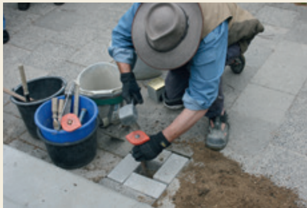
Der Kölner Künstler Gunter Demnig hat bereits mehr als 68.000 Stolpersteine für Opfer des Nazi-Regimes verlegt.

Auf den etwa 10 x 10 Zentimeter großen Stolpersteinen sind kleine Messingplatten mit den Namen und Lebensdaten der Opfer angebracht. Sie werden vor dem letzten frei gewählten Wohnort in das Pflaster des Gehweges eingelassen. Inzwischen liegen in mehr als 1.300 Städten in Deutschland und 21 weiteren Ländern Europas mehr als 68.000 Steine. Auch in Kiel werden seit 2006 jährlich neue Stolpersteine verlegt.