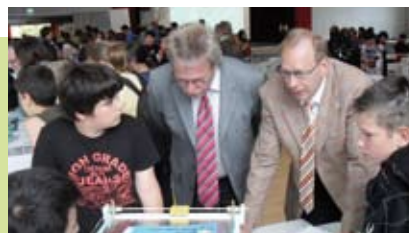
Auf einer großen Messe werden die Modelle, Ideen und Ergebnisse des Beteiligungsprozesses präsentiert und bewertet

sender Beteiligungsprozess durchgeführt, der mehrere Veranstaltungen umfasste und alle Zielgruppen des Stadtteils mit einbezog. Die hieraus resultierende Umgestaltung des Areals umfasst drei Baumaßnahmen, die räumlich nur schwer voneinander zu trennen sind: Der „Freizeit- und Bewegungspark“ im südwestlichen Bereich des Teiches und die Neugestaltung des Rundwanderweges um den Teich einschließlich der angrenzenden Grünflächen sowie der östlich gelegenen Terrassen neben der Pumpstation stellen den I. + II. Bauabschnitt der Maßnahme „Natur- und Erlebnisraum Heidenberger Teich“ dar. Die dritte Baumaßnahme umfasst die „Schulhofumgestaltung des Bildungszentrums Mettenhof“ nördlich des Teiches, zu der u.a. auch die Sport- und Spielareale des „Aktiv-Bandes“ zählen. Nachdem mit dem Bau des „Freizeit- und Bewegungsparks“ bereits Mitte 2010 begonnen werden konnte, wurde parallel im Juli 2010 eine umfassende Teichsäuberung durchgeführt, die die Landeshauptstadt Kiel aus Eigenmitteln finanzierte. Zusätzlich wurde 2010 eine Befragung vor Ort durch das Kieler Institut für Interdisziplinäre Genderforschung und Diversity durchgeführt, die darauf abzielte, auch den Aspekt der Geschlechtergerechtigkeit zu berücksichtigen und das jeweilige Nutzungsverhalten von Männern und Frauen zu erheben. Im Folgenden werden die einzelnen Maßnahmen dargestellt.