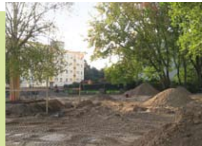
Der Platz während der Bauarbeiten