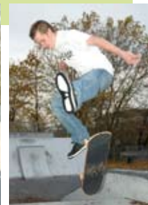
Links: Das Skater-Team Mettenhof, Rechts: Skater auf der neuen Anlage