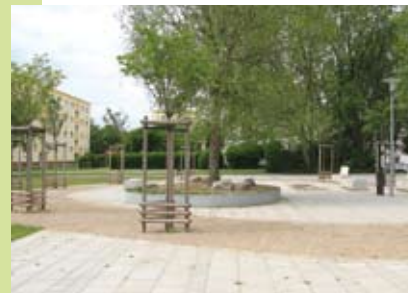
Der gleiche Blick, genau 1 Jahr später