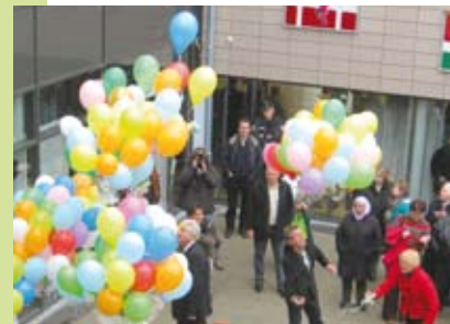
Die Eröffnung wurde im November 2008 mit einem großen Stadtteilstfest gefeiert. Ca. 4000 Besucherinnen und Besucher erlebten einen spannenden Tag mit einem großen Bühnenprogramm, vielen Informationsangeboten, kulinarischen Leckereien sowie einem bunten Programm für Kinder und Familien