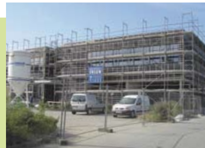
Die Bauphase des Bürgerhauses dauerte vom Frühjahr 2007 bis Herbst 2008