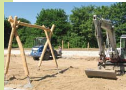
Ein Beachvolleyballfeld, eingefasst mit Hängematten und einer Schaukel entsteht