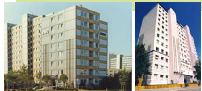
Häuser der KWG im Bergenring vor und nach Sanierungsmaßnahmen