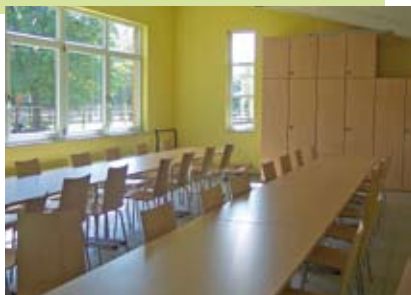
Blick in das noch nicht voll ausgestattete Gebäude