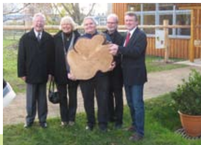
Das Naturerlebniszimmer wird eingeweiht und ein erstes Studienobjekt in Form einer Kastanienbaumscheibe als Geschenk überreicht.

Der Kinder- und Jugendbauernhof der Arbeiterwohlfahrt ist eine wichtige Institution im Stadtteil, die im Rahmen eines offenen Angebotes für alle Mettenhofer Kinder und Jugendlichen, aber auch für ortsansässige Schulen und andere Einrichtungen der Kinder- und Jugendarbeit vielfältige soziale und ökologisch orientierte Angebote vorhält und somit einen ökologisch wertvollen Lernstandort darstellt. Dieses gezielte Bildungsangebot wird zusätzlich auch von Schulen anderer Kieler Stadtteile genutzt. Die Gruppen bekommen auf diesem Wege die Möglichkeit, unter fachlicher Anleitung ihr theoretisches Wissen über biologische Zusammenhänge praktisch auf dem Hof umzusetzen. Auf diesem Wege wird nicht nur das Interesse an der Natur geweckt