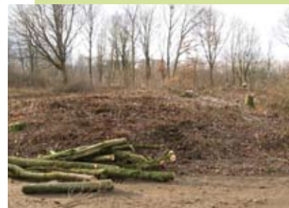
Rodungsarbeiten schufen die Grundlage für eine Neugestaltung des Areals

rasse östlich des Teiches dar. Auch diese Fläche kann sowohl zum Verweilen als auch für kleinere Veranstaltungen genutzt werden. Die angrenzende Pumpstation wurde zusätzlich durch die Landeshauptstadt saniert und optisch aufgewertet, so dass sie nun als Aussichtsplattform über den Teich in Richtung Melsdorf genutzt werden kann. Durch die Baumaßnahme ist eine Parkanlage im Stadtteil entstanden, die sowohl Naherholung als auch Begegnung, Kultur, Kommunikation sowie Sport und Bewegung ermöglicht. Für den Bereich rund um den Teich stehen die Mitarbeiterinnen und Mitarbeiter des Projekts „Wohnwissen“ derzeit als Ansprechpersonen zur Verfügung.