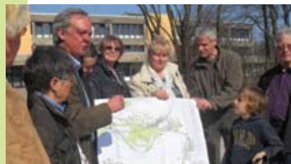
In regelmäßigen Baustellenrundgängen informieren sich Bewohnerinnen und Bewohner des Stadtteils über den Fortgang und die nächsten Schritte des Bauvorhabens