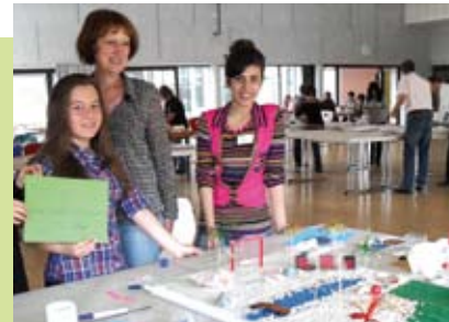
Schülerinnen und Schüler planen ihren Schulhof