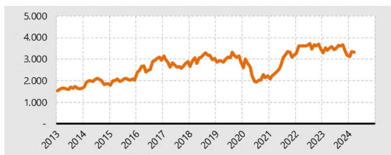
Grafik 3. Die Entwicklung der Arbeitslosen- quote in den Kreisfreien Städten Schleswig-Holsteins seit 2013