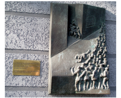
2 – Kasernengelände Arkonastraße