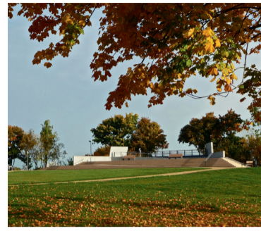
7 – Arrestanstalt der Marine / Gedenktafel