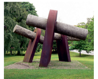
4 – Nordfriedhof