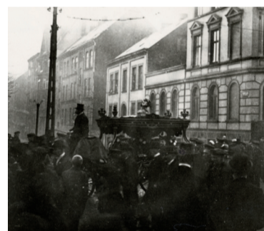
10 – Rathaus