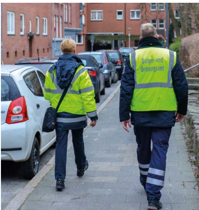
Mitarbeiter*innen des Bürger- und Ordnungsamtes im Einsatz

Begleitend hierzu wird eine Imagekampagne für die Parkraumüberwachung und das Überwachungspersonal angestoßen, da dieses häufig Beschimpfungen bis hin zur Gewaltandrohung ausgesetzt ist. Um die Akzeptanz stärkerer Kontrollen zu erhöhen, gilt es deutlich zu machen, welchen Beitrag die Parkraumüberwachung und die Überwachungskräfte leisten. Durch das Verhindern nicht regelkonformer Parkvorgänge werden erhebliche Sicherheitseinschränkungen insbesondere für Kinder, Ältere und Radfahrende vermieden und eine verlässliche Ver- bzw. Entsorgung durch Rettungsdienst, Feuerwehr, ABK und ÖPNV ermöglicht.