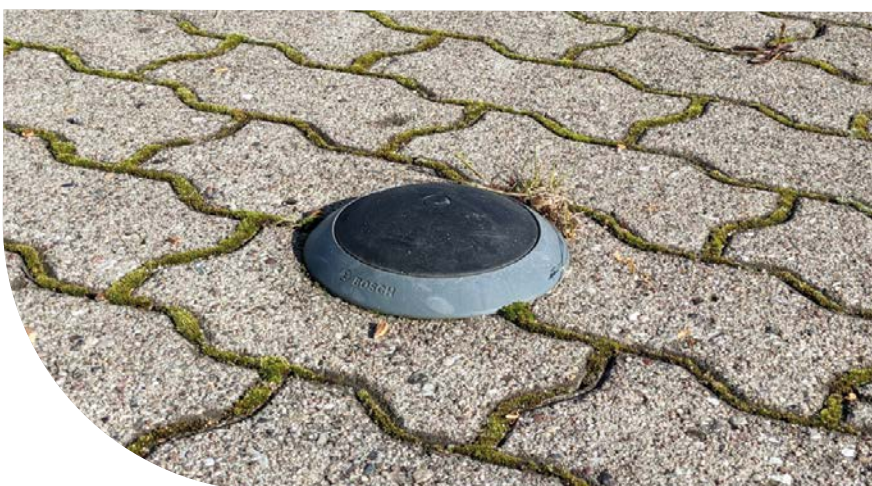
Parksensor an der Kiellinie

Darüber hinaus sollen Informationen zur Parkraumbewirtschaftung wie Bewohnerparken, Parkscheibenregelungen und monetärer Bewirtschaftung in einer digitalen Karte bereitgestellt werden, damit sich Parksuchende bereits vor Antritt ihrer Fahrt beispielsweise über die zulässige Parkdauer in den Straßen des Umfelds ihres Fahrtziels informieren können.