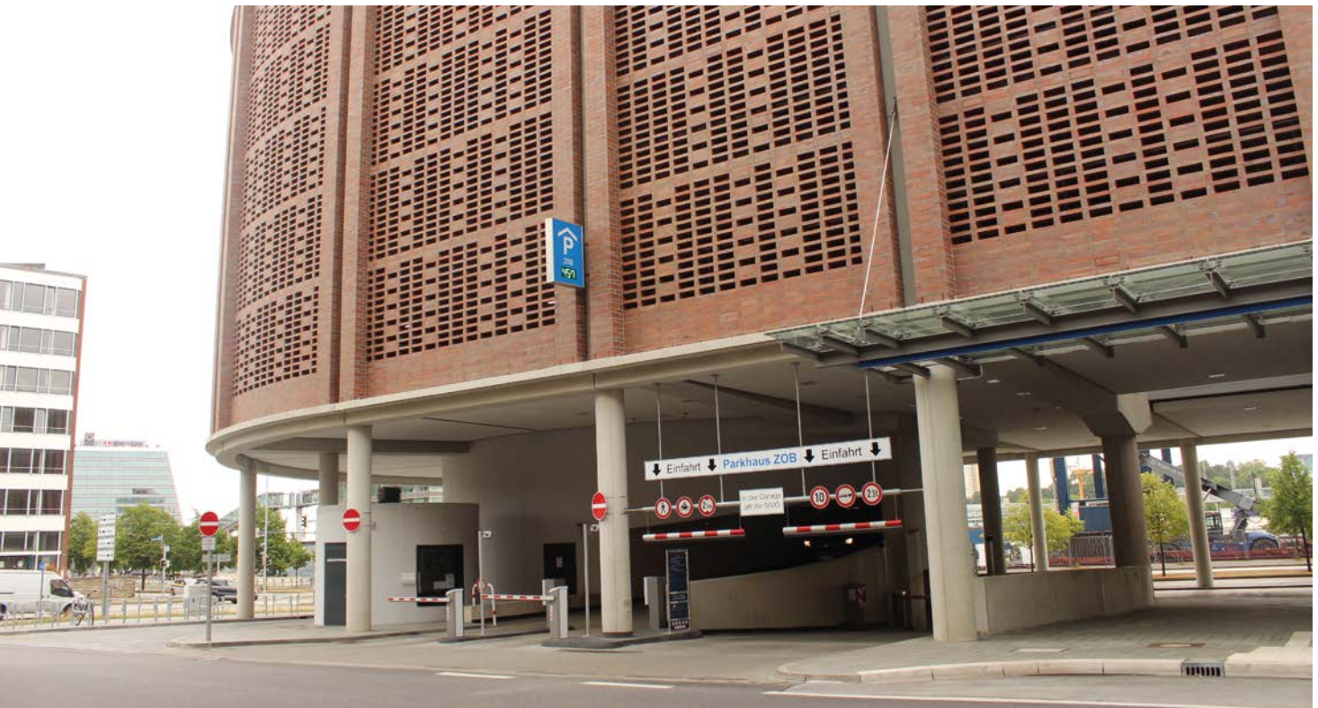
Das ZOB-Parkhaus an der Kaistraße (Zufahrt über Auguste-Viktoria-Straße)