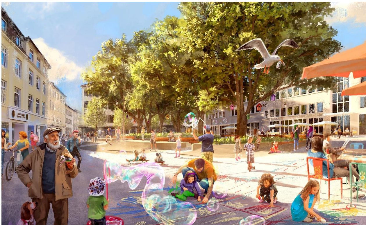
Abbildung 7: Blick aus der Faulstraße auf den Anna-Pogwisch-Platz (Visualisierung: Lohaus Carl Köhlmos)

Auf der städtischen Webseite werden die Inhalte beider Veranstaltungen ausführlich veranschaulicht und die Entwürfe des beauftragten Planungsbüros dokumentiert. Nach der Ämterbeteiligung ist eine Überarbeitung des Vorentwurfs vorgesehen, um auf Basis der vielfältigen Rückmeldungen einen finalen Baubeschluss vorzubereiten. Die Umsetzung des Projekts soll mit Hilfe von Städtebaufördermitteln finanziert werden.