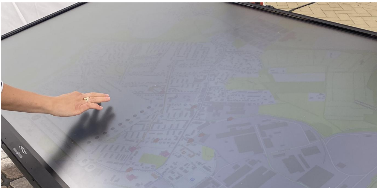
Abbildung 2: Touchtable in Pries-Friedrichsort im Einsatz

Die Beteiligung erfolgte über die Beteiligungskarte, auf der Anwohnende Gefahrenstellen, fehlende Querungen oder gute Wegeverbindungen markieren konnten. Zusätzlich kam die Funktion DIPAS-Stories zum Einsatz: In kurzen Text-Bild-Sequenzen wurden Ziele, Hintergründe und mögliche Maßnahmen verständlich erklärt und anschaulich dargestellt, was ein Fußwegeachsenkonzept überhaupt ist. Diese niedrighschwellige Aufbereitung erleichterte es Teilnehmenden, sich einzubringen und die Planungsprozesse nachzuvollziehen.