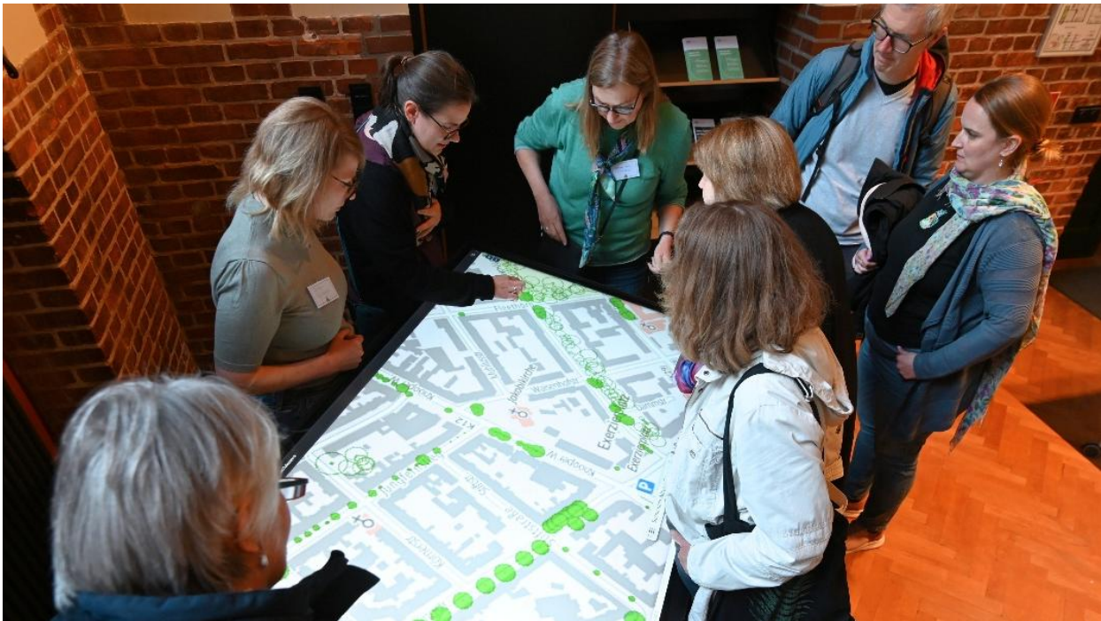
Abbildung 3 Touchtable im Einsatz beim Straßenbaumkonzept

Das Grünflächenamt erarbeitet derzeit ein Straßenbaumkonzept, das den ökologischen Wert von Straßenbäumen hervorheben und ihre besonderen Standortbedingungen im Verkehrsraum berücksichtigen soll. Ziel der Beteiligung war es, die Bevölkerung für das Thema zu sensibilisieren, ein Meinungsbild einzuholen und Hinweise aus der Bürgerschaft in die Planung einzubeziehen.