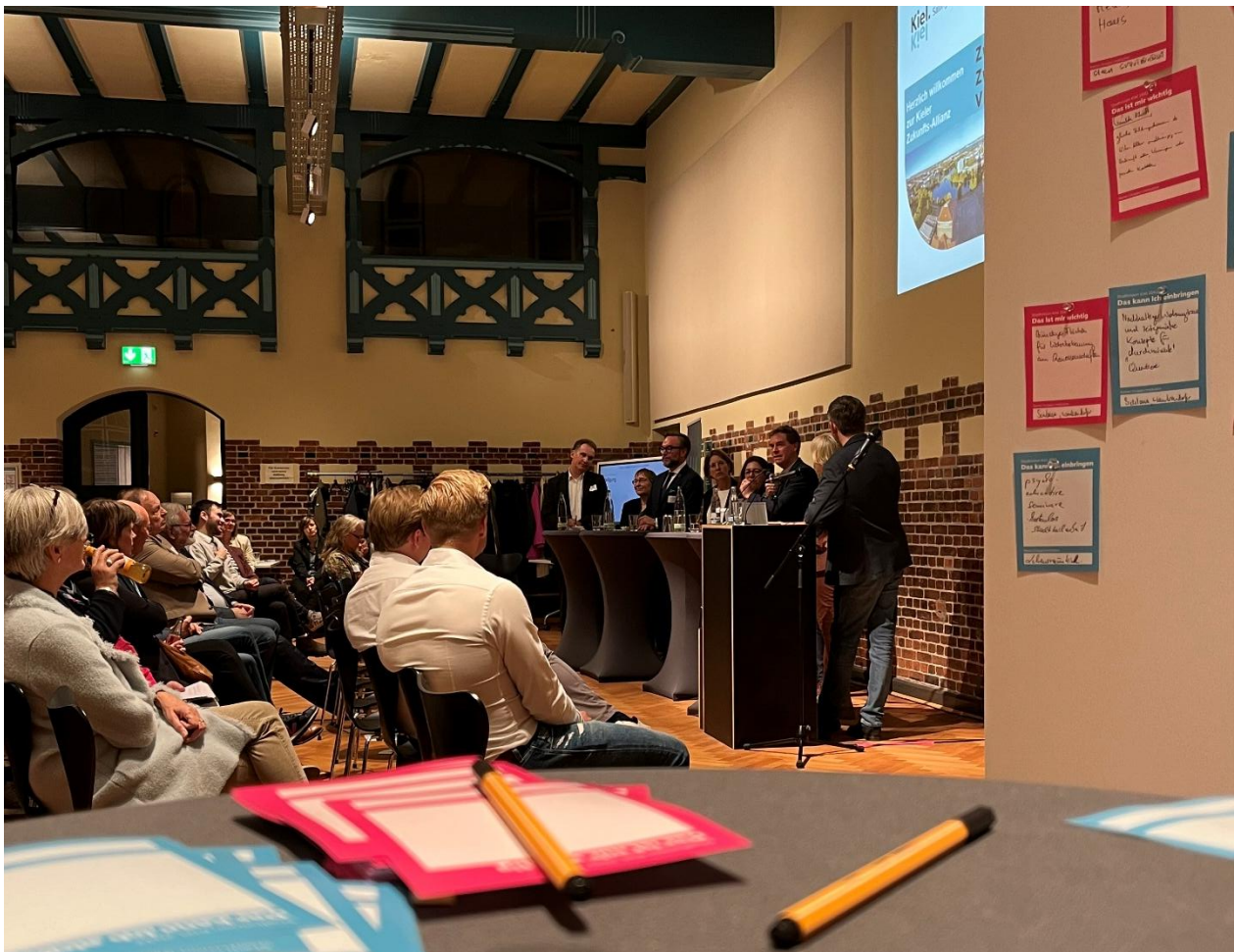
Abbildung 4: Zukunfts-Allianz für Kiel 2042 im Oktober 2023

Nach der intensiven Beteiligungs- und Konzeptionsphase bis Ende 2022 verlagerte sich der Fokus ab 2023 auf die abschließende Ausarbeitung und politische Rückbindung. Dabei standen zwei Formate im Mittelpunkt, die neue Akzente setzten: