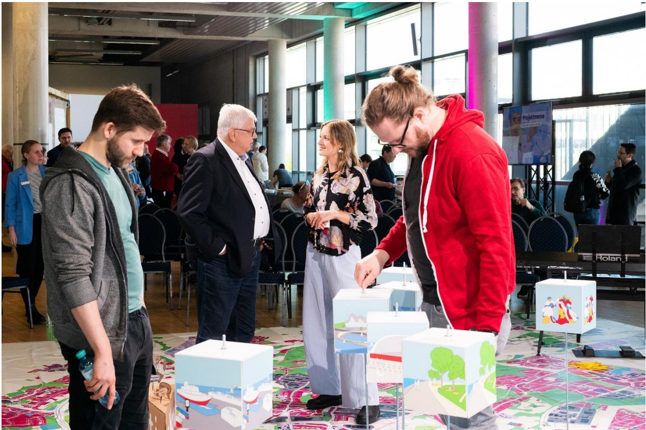
Abbildung 5: Zukunftsforum im April 2024

Zukunftsforum Kiel 2042 – Übermorgen beginnt heute (20. April 2024): Vor etwa 250 Gästen präsentierten die Landeshauptstadt Kiel und andere Institutionen auf interaktive Weise ihre spannendsten Schlüsselprojekte, die die Stadt in Zukunft prägen werden. Auf einer übergroßen Bodenkarte von Kiel lernten die Gäste die Projekte in Form einer moderierten Live-Show kennen. Im Laufe der Veranstaltung entstand Schritt für Schritt der Stadtplan von übermorgen. Mit Fachimpulsen wurde teilweise auch über die Kieler Stadtgrenze hinausgeschaut. Begleitend dazu konnten Interessierte auf der Messe der Zukunft die vorgestellten Projekte näher kennenlernen. Kulturelle Impulse ergänzten das Programm. Beide Formate unterstrichen: Die Vision Kiel 2042 wurde nicht am Schreibtisch entworfen, sondern im Dialog – und mit einer vielfältigen Stadtgesellschaft.