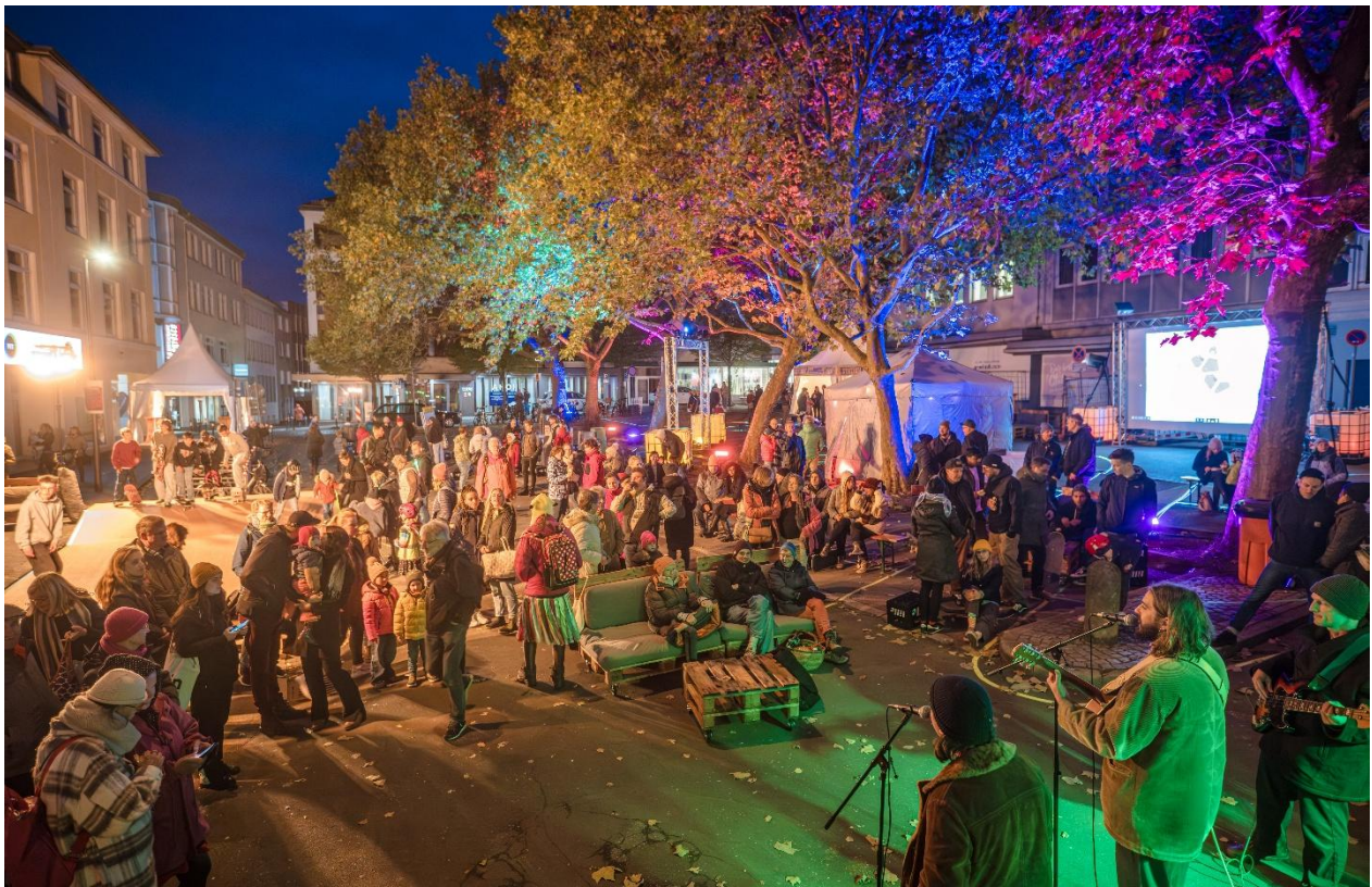
Abbildung 6: Der "Anna" soll zu einem Platz für alle werden

Die Auftaktveranstaltung „Dein Kiez, Deine Ideen, Dein Platz!“ fand am 4. November 2023 als Reallabor direkt auf dem Anna-Pogwisch-Platz statt. Sie richtete sich insbesondere an Kinder und Jugendliche als zukünftige Nutzer*innen des Platzes. Für einen Tag wurde der Platz in eine autofreie Erlebnisfläche verwandelt: Sitzgelegenheiten, Spielangebote und gastronomische Stände gaben einen ersten Eindruck dessen, was künftig möglich sein könnte. Eine DJ-Session und eine kleine Skate-Rampe, welche von dem ortsansässigen Fachgeschäft bereitgestellt wurde, zogen besonders viele junge Menschen an.