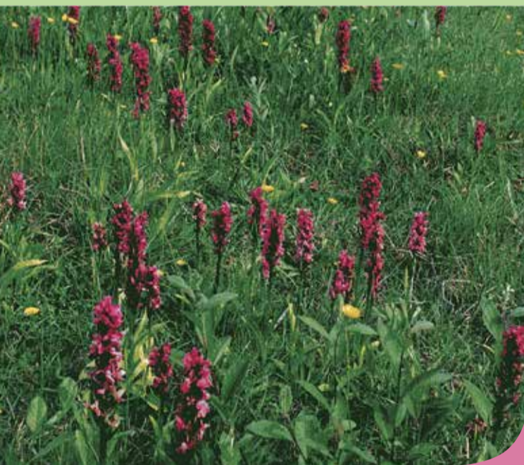
Breitblättriges Knabenkraut auf der Orchideenwiese