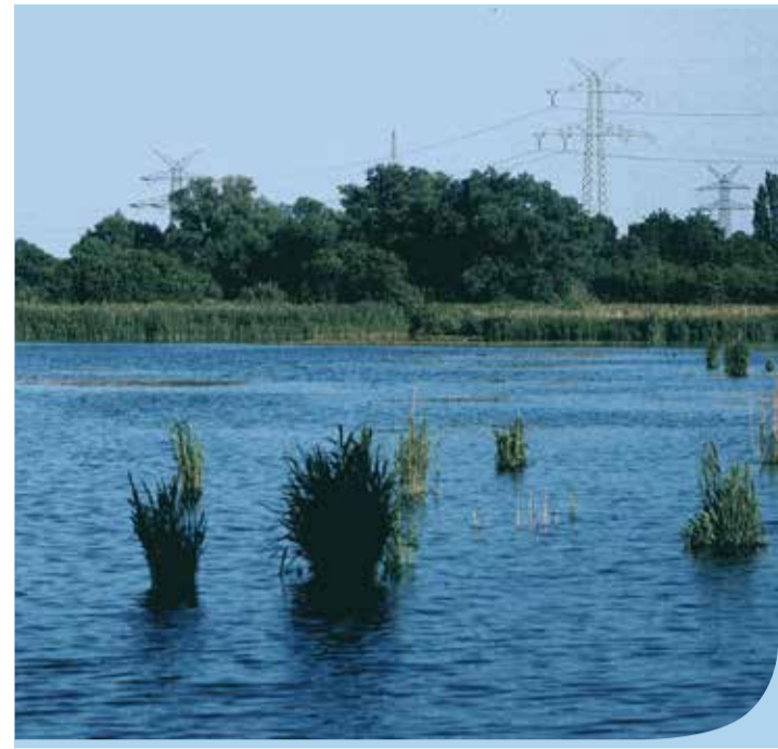
Blick auf den Mönkeberger See

Der See ist von großen Röhrichtflächen und Rieden aus unterschiedlichen Seggenarten umgeben. Im Westteil befinden sich teilweise verbuschte Gras- und Staudenfluren sowie großflächige Weidengebüsche. Im Nordwesten wächst ein kleiner Schwarzerlen-Stieleichen-